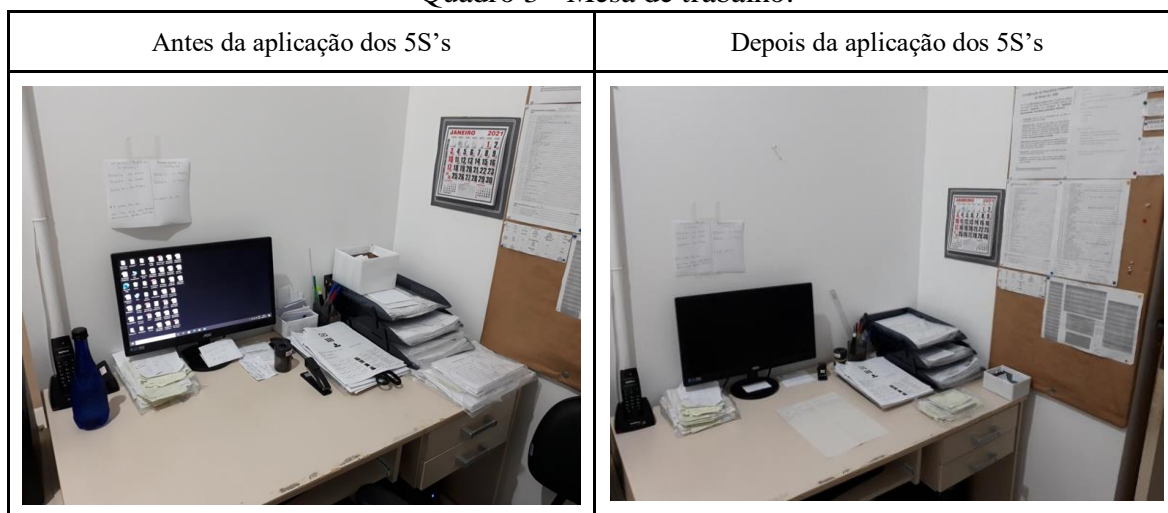
Quadro 3 - Mesa de trabalho.

Nesta seção serão apresentadas as imagens que ilustram os benefícios trazidos ao ambiente de trabalho a partir da implementação dos cinco sentidos na realidade organizacional em investigação. As imagens estão organizadas com os cenários do antes e depois da aplicação da ferramenta escolhida e expostas nos Quadros 3, 4 e 5 a seguir.