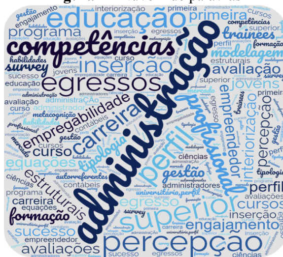
Figura 2 - Nuvem de palavras

Com relação à categoria de tendências temáticas, inicialmente procedeu-se à análise das palavras-chave dos estudos contemplados pela amostra, como indicado na Figura 2.