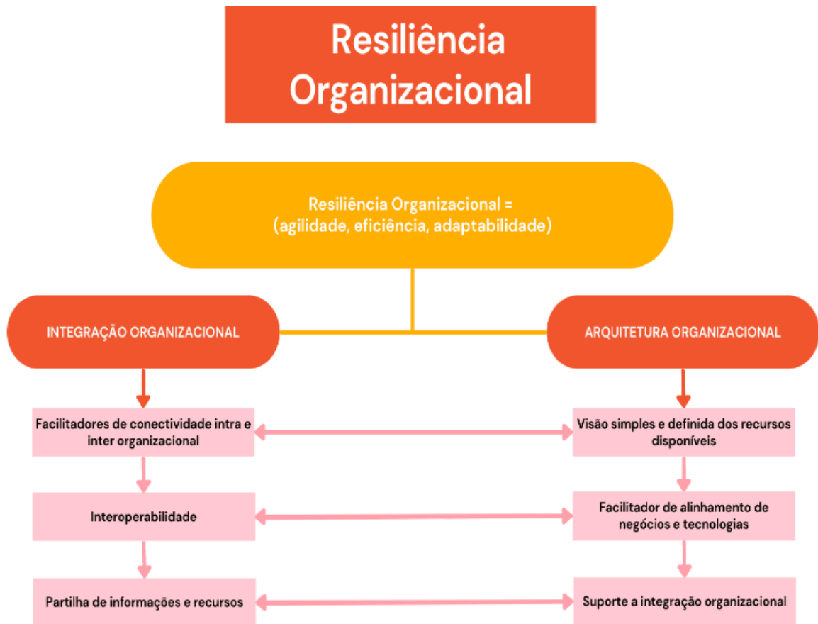
Figura 2 - Facilitadores da Resiliência Organizacional